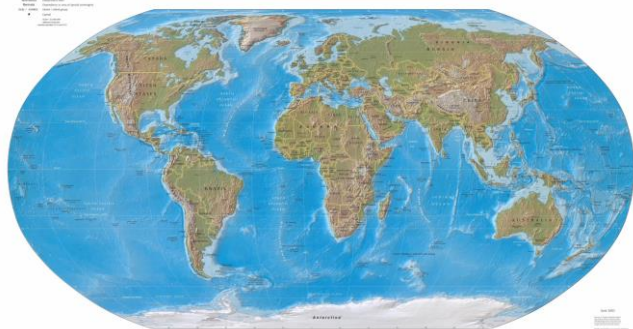
Physical Map of the World, June 2023

Melyik életközösséget ismered fel a képek alapján? Mutass be egy minimum öt tagú táplálékhálózatot!